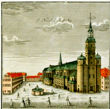
Das etwa zwei Stunden dauernde Werk wurde am Karfreitag, dem 7. April 1724, in der Leipziger Nikolaikirche uraufgeführt.

So wird die Handlung durch 10 Arien unterbrochen, die zum vertiefenden Betrachten der Stationen der Passionsgeschichte einladen. Die 12 Choräle bilden eine Brücke zwischen der in der dargestellten historischen Situation und der gegenwärtigen Lebenswirklichkeit des Glaubenden. Der Choral als Symbol für die Gemeinde möchte hier den direkten Bezug zur persönlichen Betroffenheit herstellen. Die Anzahl der Choräle kann als Verweis auf die 12 Jünger Jesu verstanden werden. Sie geben in der Summe am Schluss der Passionsgeschichte der individuellen Auferstehungshoffnung Raum.