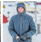
Die Temperaturen, vor allem aber der Wind, sind eine echte Herausforderung.